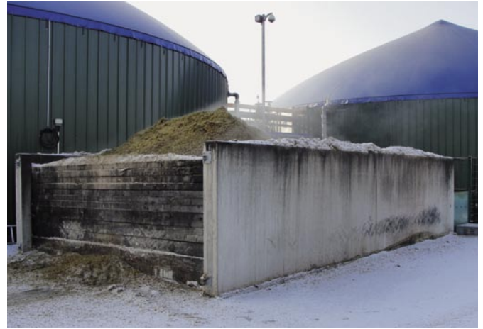
Bild 11: Eintragsbunker für feste Gärsubstrate unterliegen einem starken chemischen Angriff.

Feste Gärsubstrate (z.B. Silage) können über Eintragsbunker, Vorratsbehälter oder Schiebeböden in den Fermenter dosiert