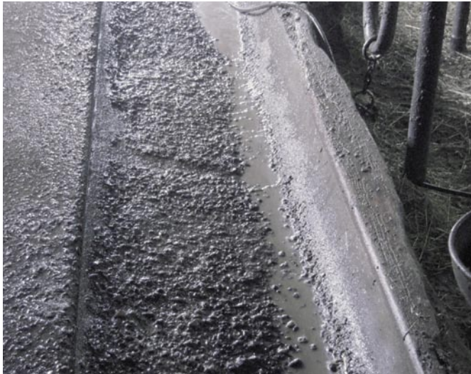
Bild 2: Die Rauigkeit des Futtertrogs ist auf den langjährigen chemischen Angriff beim ungeschützten Beton zurückzuführen

In diesem Beitrag wird aber nicht über durchaus messbare Verbesserungen (z.B. Verringerung der Futterverluste, Vermeidung von Gärprozessen und Ansiedelung von Mikroorganismen, einfache und rasche Reinigung, Einsparung an Arbeitszeit) informiert, es soll vielmehr eine einfache und wirkungsvolle Methode der Instandsetzung von Betonbauteilen am Beispiel Futtertrogs dargestellt werden.