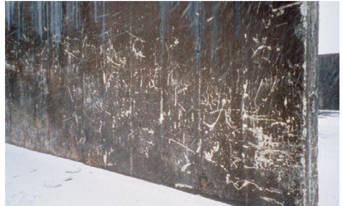
Bild 6: Anstriche und Beschichtungen für Gäruttersilos weisen oft eine nur kurze Lebensdauer auf.

Diese Bauweise hat sich seit vielen Jahren bewährt. Erstmals 1993 wurde sie in ein Merkblatt für den Gärfutter-Silobau aufgenommen [7] und danach in die DIN 11622-2 [3] übernommen. Außerdem weisen die für Gäruttersilos üblicherweise verwen-