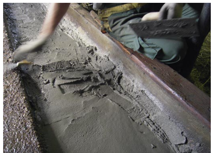
Bild 5: Auftrag des Instandsetzungsmörtels in einer Schichtdicke von etwa 1,5 cm