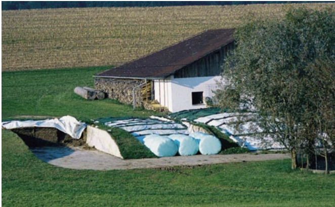
Bild 5: Gäruttersilos mit hohem Frost-Taumittel-Widerstand ohne zusätzlichen Schutz des Betons haben sich in den vergangenen 20 Jahren bewährt.

geführten Regelungen nur für natürliche Böden und Grundwasser gelten – dazu gehören Gärsäfte sicher nicht.