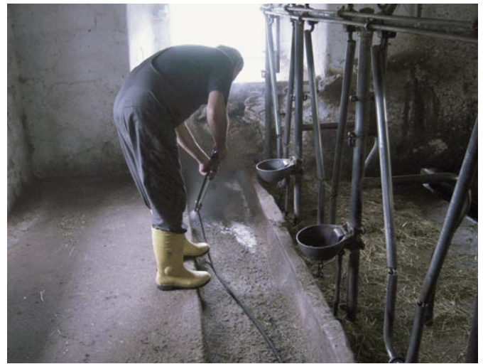
Bild 3: Die Reinigung und Untergrundvorbereitung erfolgte in diesem Fall mittels Hochdruckreiniger

Im konkreten Fall wurde die Untergrundvorbereitung sorgfältig mittels Hochdruckreiniger durchgeführt (Bild 3), wobei dies