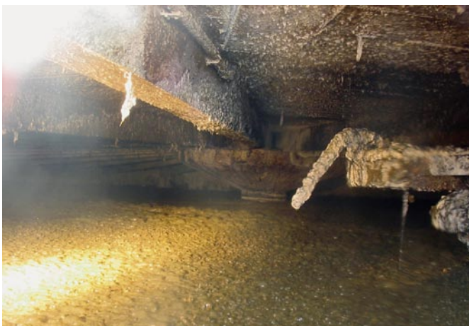
Bild 9: Biogas-Fermenter unterliegen vor allem im Gasraum einem starken chemischen Angriff.

Die landwirtschaftlichen Gärsubstrate und ihre Abbauprodukte stellen im flüssigkeitsberührten Bereich eine chemisch schwach angreifende Umgebung für Beton dar (XA1). Werden organische Stoffe von außerhalb des landwirtschaftlichen Produktionskreislaufs zur Biogaserzeugung eingesetzt, ist im Einzelfall über den Betonangriff zu entscheiden.